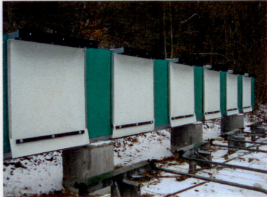
Zwingen / Künstliche Kugelfangkasten 50m